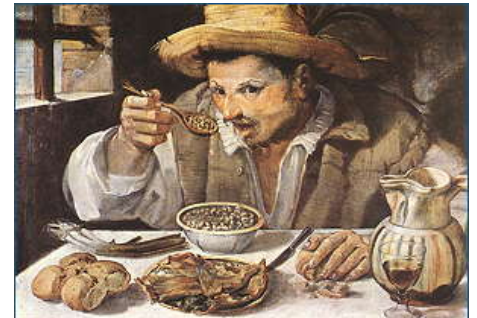
Annibale Carracci, il mangiatore di fagioli Olio su tela, 57 x 68 cm Galleria Colonna, Roma

Tabella: dosi a persona a seconda del tipo di prodotto